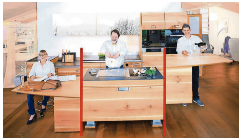
Für die höhenverstellbare Küche wurden die Möbelmacher für den Innovationspreis Bayern nominiert.